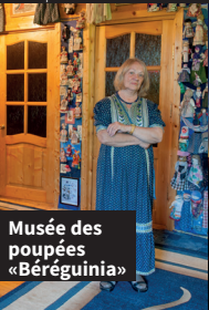
Musée des poupées «Béréguinia»