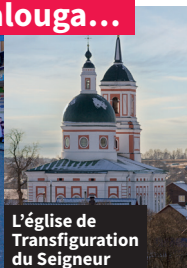
L'église de Transfiguration du Seigneur